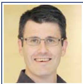
Pr Pierre SAINTIGNY